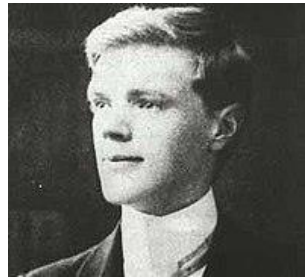
David Herbert Richards Lawrence

„Azt hiszem, a hangnak sok iskolázás kell, míg igazi éneklésre képes.”